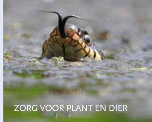
ZORG VOOR PLANT EN DIER

Voor dieren is het belangrijk om schuilplekken te hebben, zo ook voor de ringslang. De ringslang is de grootste, niet giftige slang die in Nederland voorkomt. Het Utrechts Landschap heeft een ringslangenhoop gemaakt, een broeihoop waarin het vrouwtje haar eieren kan leggen. Er zijn nog meer schuilplaatsen op Rusthof, zoals de insectenhôtels die her en der zijn opgehangen.